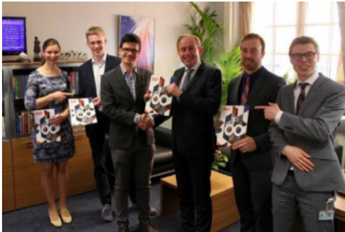
Presentatie van de glossy 'SGP 100' bij de SGP-fractie in de Tweede Kamer te Den Haag.